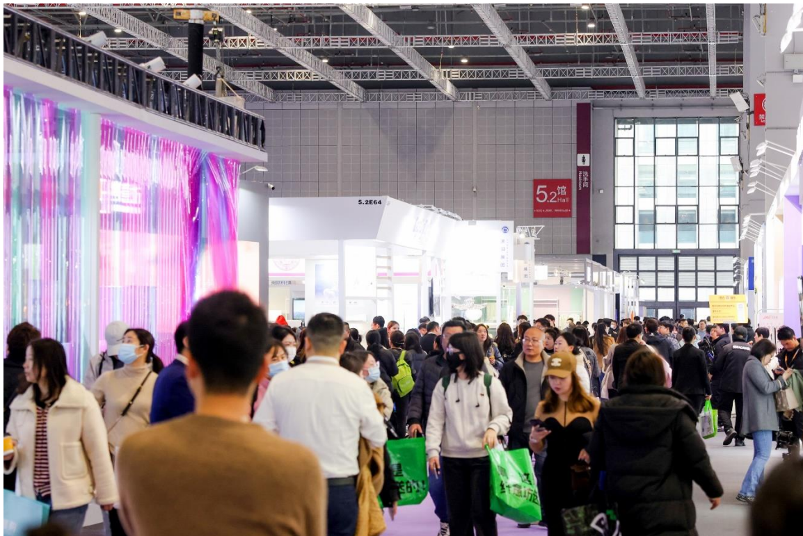
成群結隊的買家在各家展台採購琳琅滿目的產品。

上海，2024年3月20日。中國國際家用紡織品及輔料（春夏）博覽會（以下簡稱 Intertextile 上海春夏家紡展）在3月8日閉幕，在3月6至8日的展會期間迎來了來自7個國家和地區的339名參展商，和來自56個國家和地區的23,700名專業買家。隨著中國消費者不斷改變的需求，舒適性成為他們選品時考慮的重點之一，因此，高品質、具功能性及可持續性的家用紡織品已成為當今市場的主導趨勢產品。參展商在展覽面積達27,000平方米的展會上呈現了各類符合市場趨勢的創新家紡。除了展示多樣產品之外，展會期間還舉辦了一系列增值的同期活動，幫助買家獲取更多第一手的市場資訊，並建立高質的業務聯系。